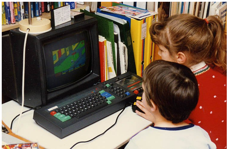
Niños jugando en un computador Amstrad CPC 464 en los años 1980

generalmente llamados microcomputadores, fueron vendidos a menudo como kit electrónicos y en números limitados. Fueron de interés principalmente para los aficionados y técnicos.